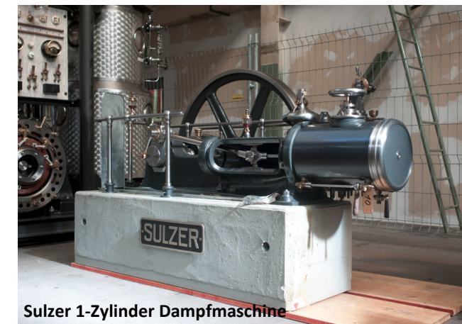
Sulzer 1-Zylinder Dampfmaschine

Das Sammelgut ist in Winterthur, auf dem ehemaligen Sulzer Areal, in der Halle 181 der Stiftung Abendrot eingetroffen. Für einige Exponate hat sich der Kreis geschlossen: exakt dort, wo das Dampfzentrum Winterthur entstehen soll, sind einst unzählige Dampfmaschinen gebaut worden – darunter eine grosse Anzahl der künftigen Ausstellungsstücke. Bis zur Eröffnung der offenen Fabrik organisiert der Verein (vdw) für das interessierte Publikum auf Anfrage Führungen. Zusätzlich ist ein Dampfevent – mit einem „Tag der offenen Tür“ – vorgesehen.