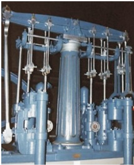
1859 Wattsche Balancierdampfmaschine 1-Zylinder Pumpen-Dampfmaschine Giesserei- und Maschinenfabrik, Berlin