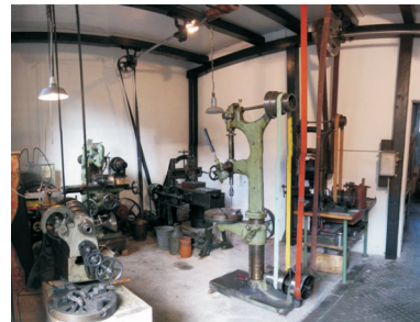
Um 1900 Transmissionswerkstatt