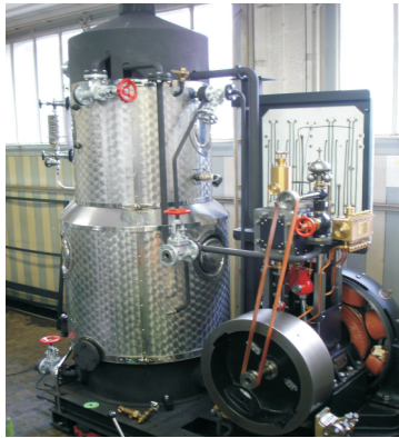
1880 Dampf-Dynamogruppe 1-Zylinder Dampfmaschine King, Zürich Gleichstromgenerator Alioth, Münchenstein 1960 Dampfkessel Ott, Worb